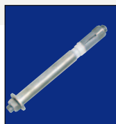
Systeme de fixation

La gamme des serrures électroniques Ev'Hora (A2P niveau B/E) (2) . Disponible en trois versions, serrures autonomes, serrures en réseaux et serrures pilotées, la gamme Ev'Hora est modulaire et évolutive. Elle s'adapte aux besoins de votre exploitation, tant en terme de procédures que de paramétrage.