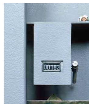
Le compteur et le scellé du foncet (en option): de précieux indices pour savoir si l'armoire a été ouverte en votre absence.